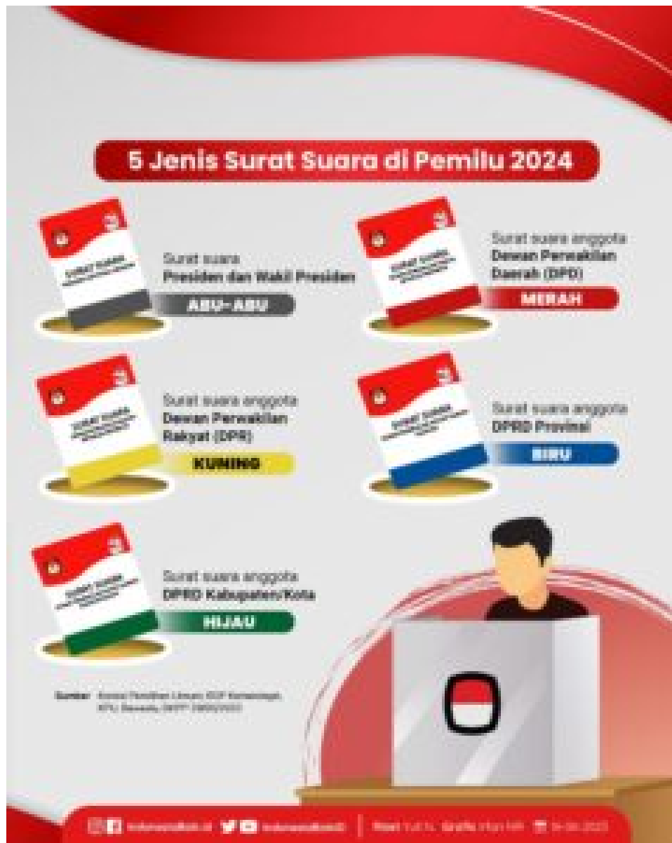
Surat suara Pemilu 2024.