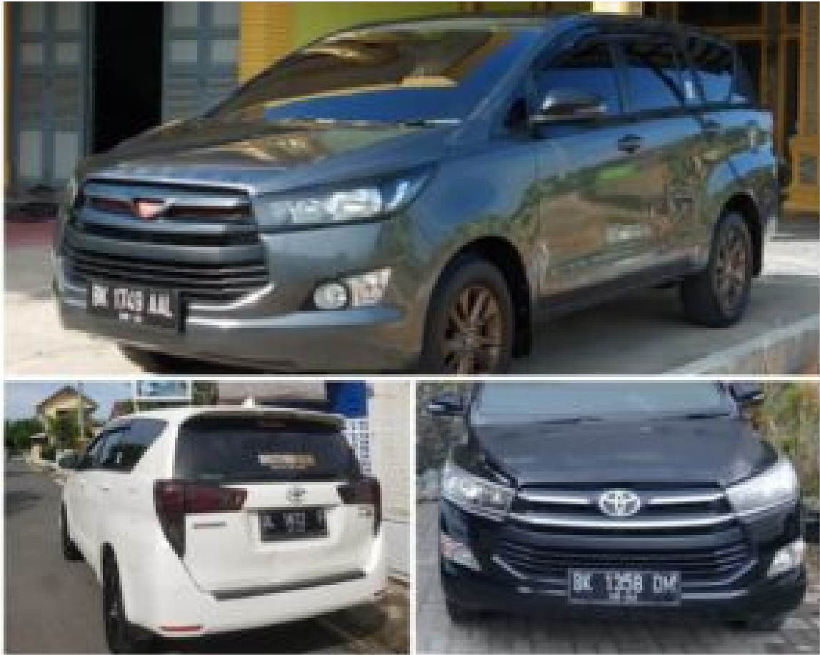
Tiga unit mobil Innova Reborn yang digelapkan.

Ketiganya merupakan warga Kota Langsa dan telah membuat laporan pengaduan ke Polres Langsa, dengan tanda bukti lapor Nomor: SKTBL/168/IX/2021/SPKT/POLRES LANGSA/POLDA ACEH, nomor: SKTBL/161/VIII/2021 ACEH/SPKT/POLRES LANGSA/POLDA ACEH, dan Nomor: SKTBL /164/VIII/2021/SPKT/POLRES LANGSA/POLDA ACEH.